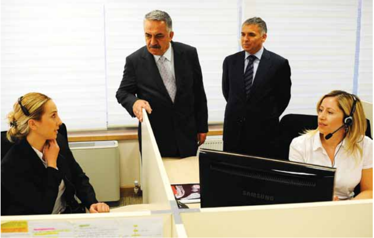
Devlet Bakanımız Sayın Hayati Yazıcı'nın Çağrı Merkezimizi Ziyareti

Yoksullukla mücadele kapsamında fakir ve muhtaç vatandaşlarımızın güçlendirilmesi ve bilgiye ve yardıma erişim fırsatlarının artırılması amacıyla Genel Müdürlüğümüz tarafından hayata geçirilen Alo 144 Sosyal Yardım Hattı, Avrupa Birliği'nin (AB) 2010 Yılı Türkiye İlerleme Raporu'nda yer aldı.